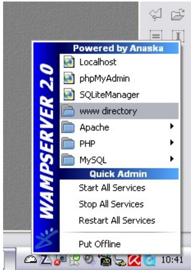
l'interface graphique du serveur wamp

Dans la fenêtre qui s'ouvre, créez un dossier PHP et glissez-y votre fichier test.php.