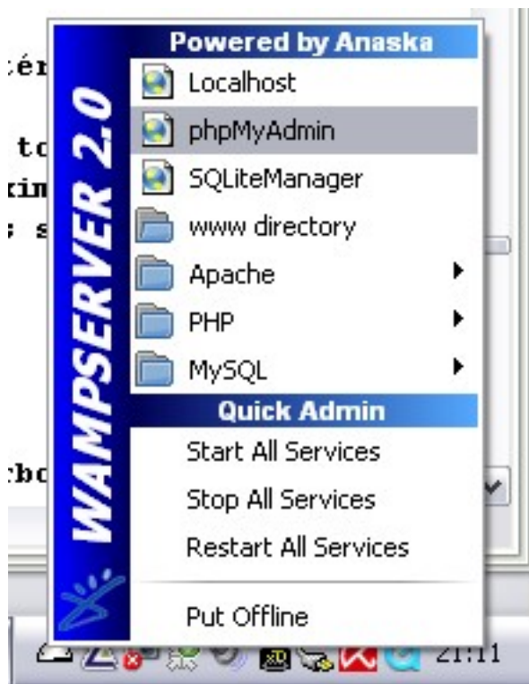
Accès à phpMyAdmin

Cliquez sur l'icône de WampServer, puis cliquez sur phpMyAdmin .